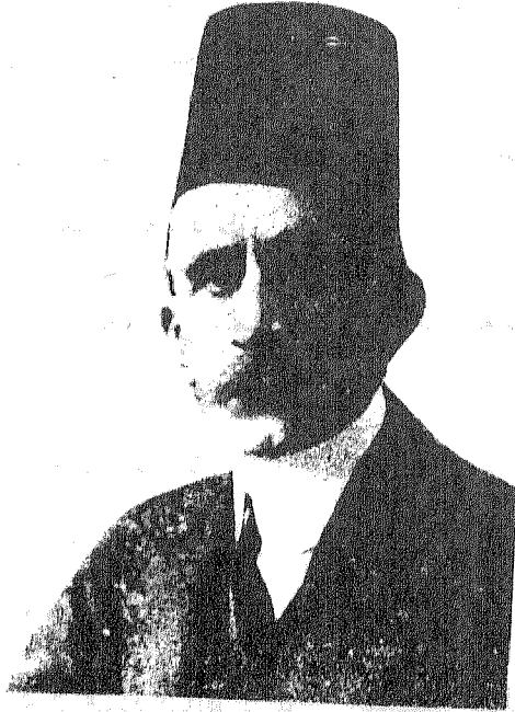
السلطان حسين كمال